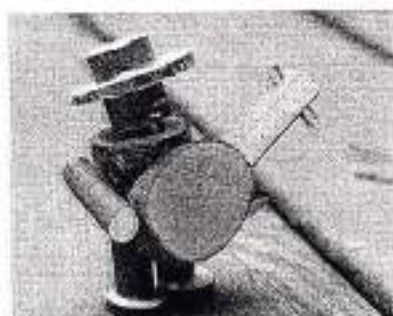
(小枝で作った「森の音楽隊」)

材料なんかも、特に小枝が好きです。細いものなら森の中や家の近所の公園でも落ちていたり、そんな身近で手に入りやすい小枝が一工夫で素敵なものに生まれ変わる魅力がいいんです。